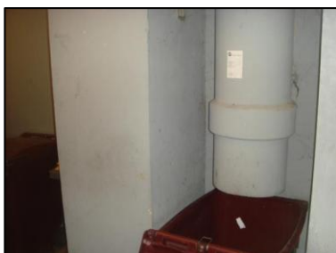
Photo N° 6155 AMIANTE CIMENT -- LOCAL VO RDC à +4 Vide-ordures Gaine V.O.(Fibres-ciment)